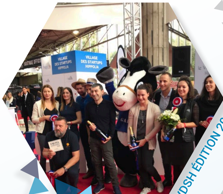
VDSH ÉDITION 2018