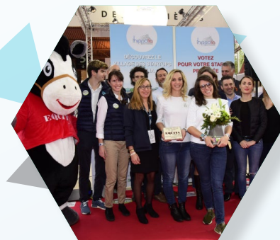
VDSH ÉDITION 2017