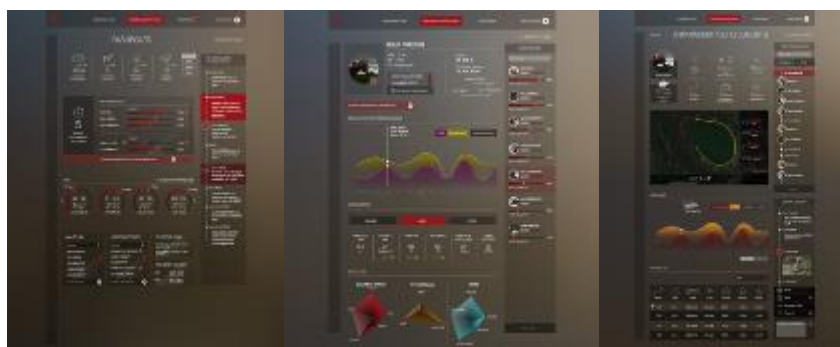
Interface suivi entraîneur